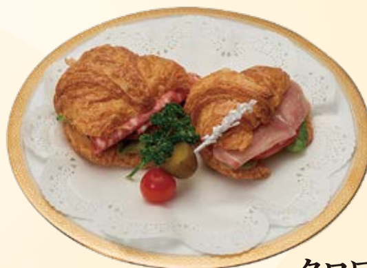
クロワッサンサンドイッチ 1,320円

※記載されているメニューは一例です。 ※料金はすべて消費税(10%)を含んでおります。 ※写真はイメージです。