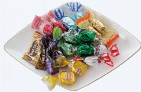
キャンディー取り合わせ