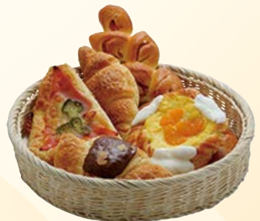
デニッシュペストリー 330円～／個