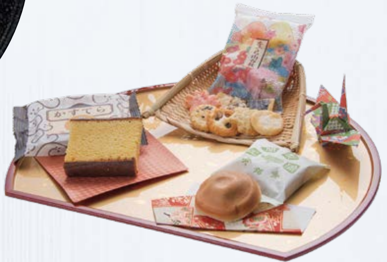
※各種盛合せイメージ