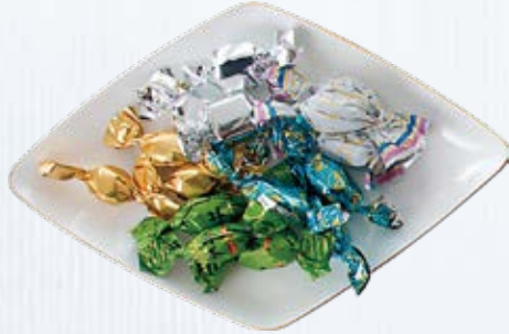
チョコレート取り合わせ

和テイストのお菓子から洋菓子、キャンディー等 バラエティーに富んだメニューをご用意しています。