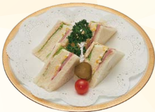
ミックスサンドイッチ 1,320円